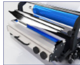
Extracción en pocos segundos