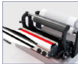
Cambio rápido de cámara