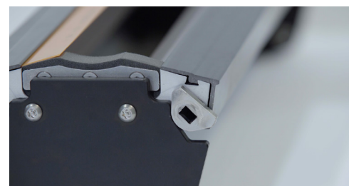
Sistema di fissaggio rapido della camera TRESU